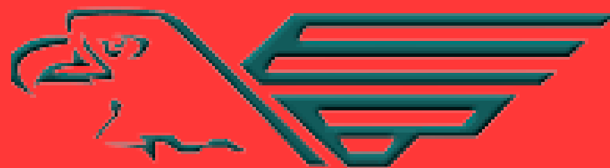
EAGLE BUTTE HS