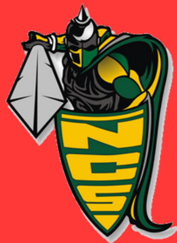
NOBLE CENTRAL SCHOOL