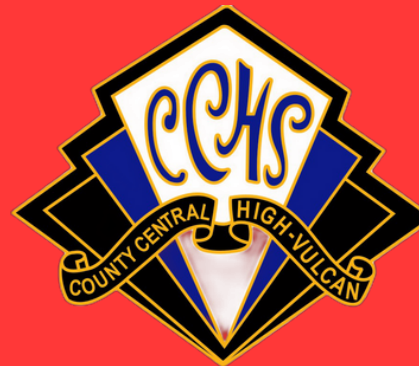
COUNTY CENTRAL HS